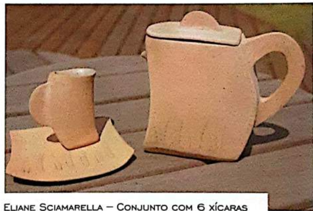
ELIANE SCIAMARELLA – CONJUNTO COM 6 XÍCARAS

Na prática, os artistas se propõem a realizar oficinas para alunos de escolas públicas e membros de comunidades carentes da região; buscar parcerias nos âmbitos público e privado, para um maior fomento da atividade; promover congressos, seminários e outros eventos; e ainda promover a exposição e a comercialização da produção local. As ações, de acordo com as diretrizes do coletivo, servem todas ao mesmo propósito: “retomar e fortalecer a tradição ceramista de Petrópolis e fazer da cidade polo reconhecido de produção de cerâmica artística, que se constitua em forte atrativo turístico e fator de geração de trabalho, emprego e renda”.